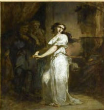
7. Charles-Louis Müller (1815 – 1892), Lady Macbeth , début du XIX e siècle, huile sur toile, 38 cm x 29 cm, Ajaccio, Palais Fesch-musée des Beaux-Arts