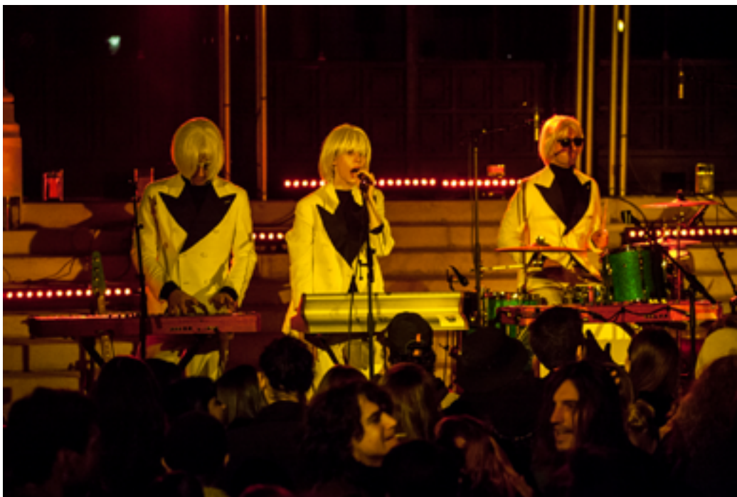
Vue de Paris Musées OFF - concert de La Femme au Palais Galliera

En 2021, plus de 25 000 personnes relevant des structures sociales, médico-sociales, établissements scolaires et centres de loisirs ont bénéficié d'activités de médiation au musée, « Hors les murs » ou à distance. Les Paris de l'art confirment leur succès : pour la saison 2021-2022, 1 400 personnes suivent les cours d'histoire de l'art des musées de la Ville de Paris. La carte Paris Musées compte 23 000 adhérents.