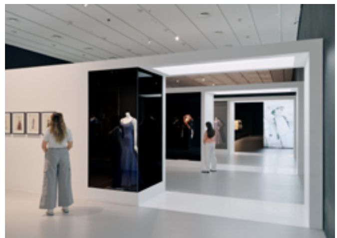
Vue de l'exposition Gabrielle Chanel. Manifeste de mode à la National Gallery of Victoria