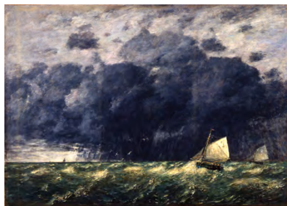
Eugène Boudin (1824-1898), Un grain, 1886, Huile sur toile, 117 x 160 x 3 cm, Musée de Morlaix

Le musée de la Vie romantique invite à découvrir une thématique emblématique et fascinante de la première moitié du XIX e siècle et l'une des plus puissantes sources d'inspiration de l'univers romantique : les tempêtes et naufrages. Cette exposition souhaite ouvrir la programmation du musée au-delà de ses collections centrées sur la vie parisienne des salons en explorant la diversité picturale du romantisme et en mettant en lumière ce nouveau regard porté sur la nature et les paysages maritimes comme reflet de l'âme romantique.